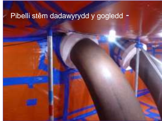
Pibelli stêm dadawrydd y gogledd -

Ar 10 Ionawr, roedd 55% yn gyffredinol o'r tanwydd wedi'i symud o'r Adweithyddion, gyda 27,678 o elfennau tanwydd sydd wedi'u defnyddio ar ôl yn Adweithydd 1 ac 17,280 yn Adweithydd 2.