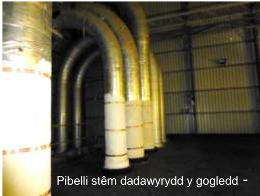
Pibelli stêm dadawrydd y gogledd -

Mae'r rhaglen waith asbestos yn gwneud cynnydd da, a hyd yma mae dros 50 o dunelli o ddeunyddiau sy'n cynnwys asbestos wedi cael eu symud. Mae mwy na 300 o leoliadau wedi cael eu cwblhau yn ardaloedd arbed Adweithydd 1 ac Adweithydd 2, pontydd pibelli a'r amlenni De a Gogledd.