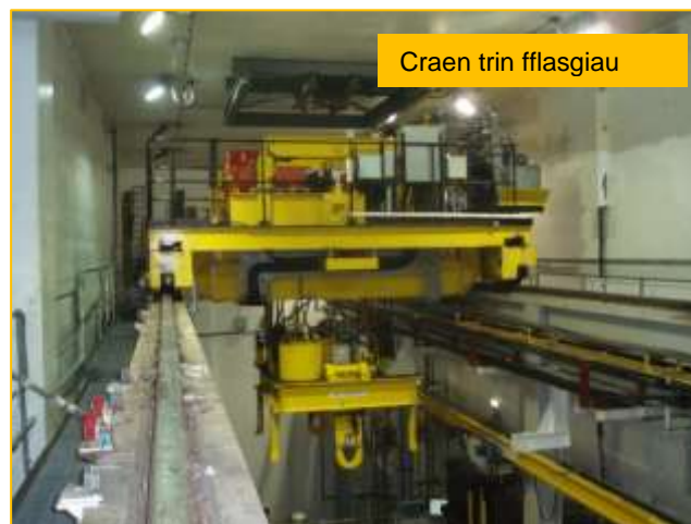
Craen trin fflasgiau

Cyfyngwyd ar y gwaith llenwi fflasgiau ers mis Rhagfyr, a hynny oherwydd problemau gyda'r Craen Trin Fflasgiau. Mae llawer o waith cynnal a chadw wedi cael ei wneud ers hynny. Ac ers 17 Ionawr rydyn ni'n comisiynu ac yn dod â'r craen yn ôl i wasanaeth ac yn bwriadu aildechrau llenwi fflasgiau yn yr wythnos yn dechrau 22 Ionawr.